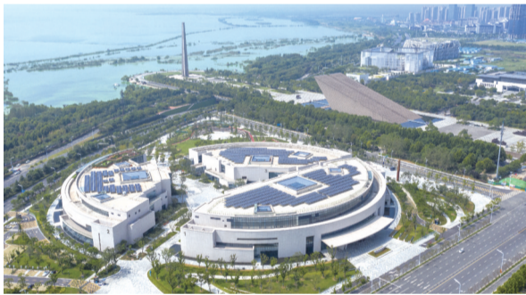
总书记视察的安徽创新馆与渡江战役纪念馆

今年入梅以来，巢湖流域连续遭遇九轮强降雨，雨情水情汛情多项数据超历史极值，巢湖防汛形势十分严峻。