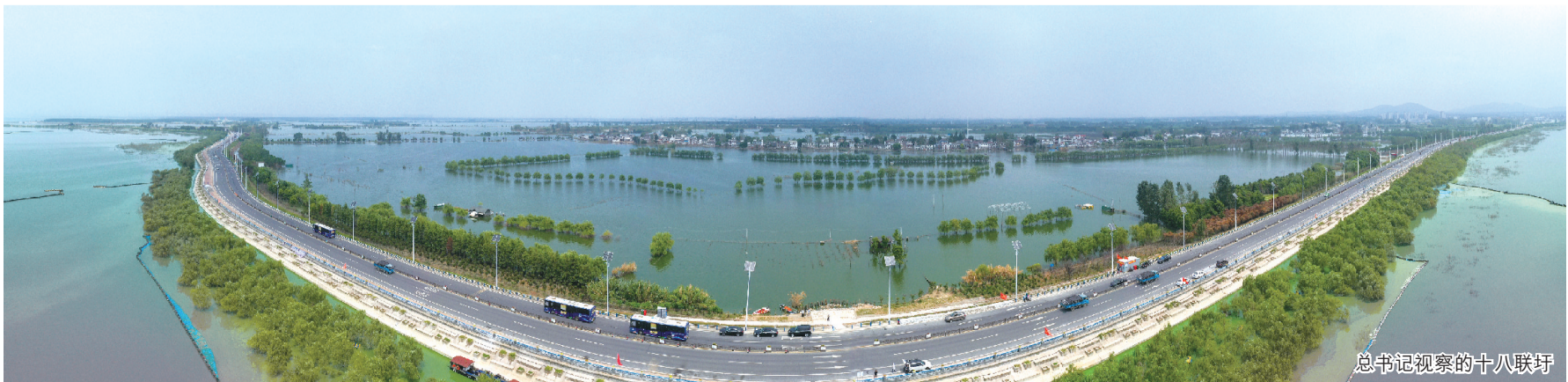
总书记视察的十八联圩