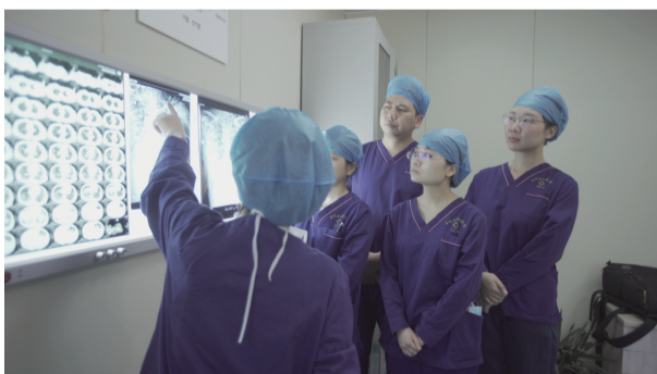
张主任正在分析病情