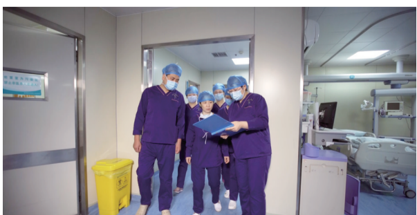
ICU团队交班后进病房