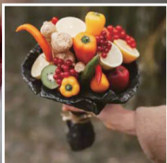
青椒、奇异果、柠檬、姜和玫瑰浆果