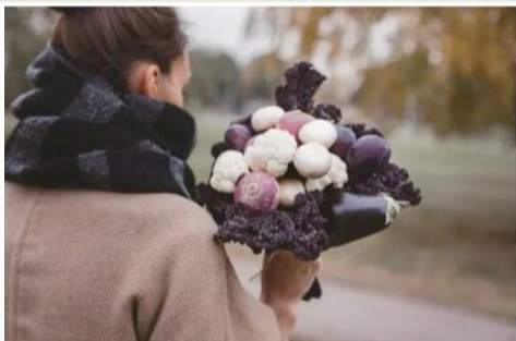
花椰菜、茄子、蘑菇、李子、萝卜