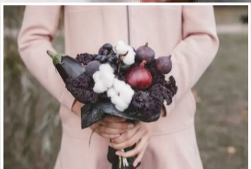
紫甘蓝、茄子、洋葱和无花果