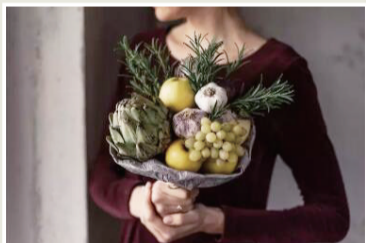
这款颜色搭配比较做旧的感觉,用了洋葱、葡萄、苹果、大蒜和迷迭香