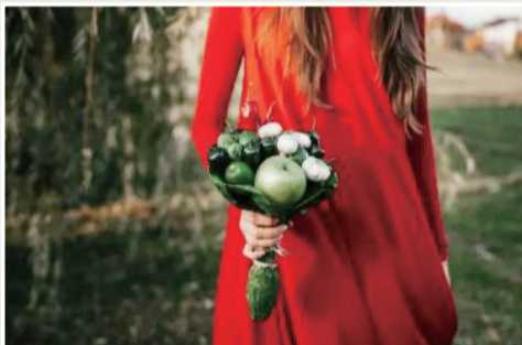
苹果、墨西哥胡椒、蘑菇、大蒜、辣椒