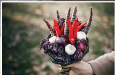
紫色色调比较少见,紫甘蓝、紫胡萝卜、红辣椒、洋葱和大蒜