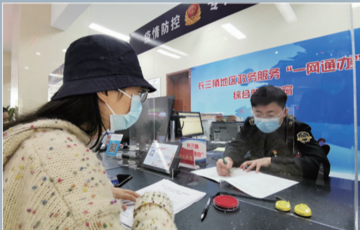
图为瑶海区长三角地区政务服务“一窗通办”综合服务窗口正在办理业务