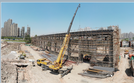
瑶海区长江180二期的厂房修复改造工作正在进行