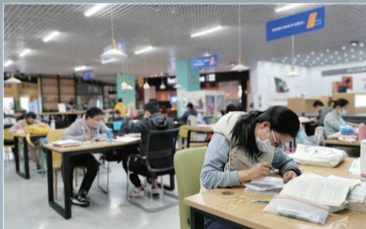
市民、企业的各项服务休闲工作都已恢复,图为市民在瑶海图书城里自习

在解除封闭式管理后,瑶海立即行动起来,变审核备案的管理模式为帮扶整改的服务模式,结合“四送一服”专项行动的深入落实,点对点走访企业,加大疫情防控、用工保障、减费降税、金融扶持等帮扶性政策宣传,及奖扶政策的兑现力度。同时,着重对接企业需求,积极帮助企业联系口罩、测温枪等防疫物资生产经营厂家,协调解决企业复工复产中的实际困难,为中小企业(店铺)开业开门全面复工复产助力。