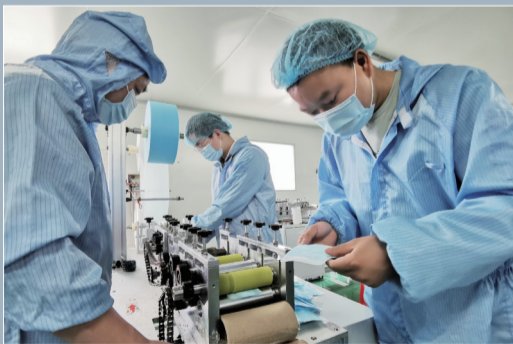
在位于瑶海区的安徽国泰瑞医药有限公司,工人们正在制作医用防护口罩。据了解,该企业的日产量可达100000只