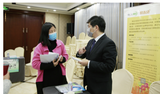
蜀山经开区银企相亲会引金融活水助力企业渡难关