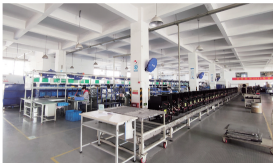
安徽宾肯电气股份有限公司生产车间一角

蜀山区相关负责人介绍，蜀山区将开展财政支持深化民营和小微企业综合服务综合改革试点城市工作，有效引导金融资源在尊重市场规律的前提下“支小助微”，更好地利用市场化手段创造良好环境，激发内生动力。同时，探索深化民营和小微企业综合服务的模式，建立健全融资担保体系和风险补偿机制，形成蜀山经验，放大政策效果。