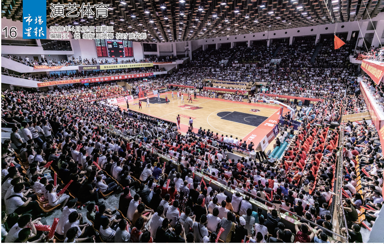
安徽文一男篮主场火爆