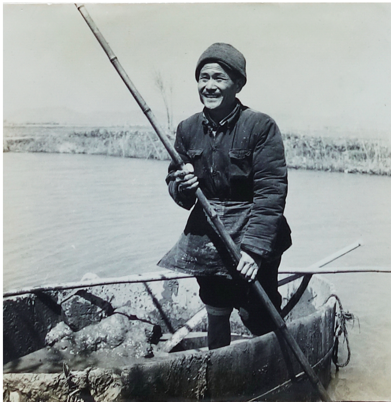
渡船照(此照片曾刊于1959年的《安徽画报》)