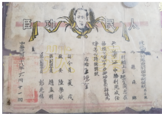
被授予“特等渡江功臣”的奖状