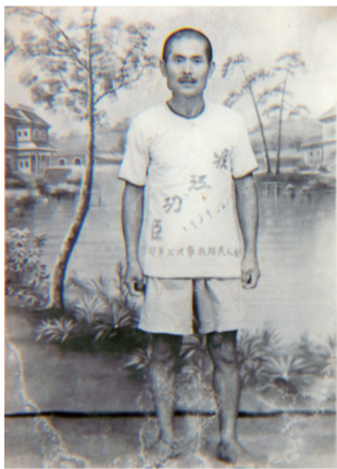
身着印有“渡江功臣”的汗衫旧照

生在外地,未及及时接到通知。1953年,又邀请他进京过国庆节,当时的他负责基层党组织工作,忙得分不开身,最终也未能赴京。数次错失被中央领导接见的机会,加之为人老实忠厚、不善言辞,久而久之,这个特等功臣,逐渐进入“被遗忘的角落”里。