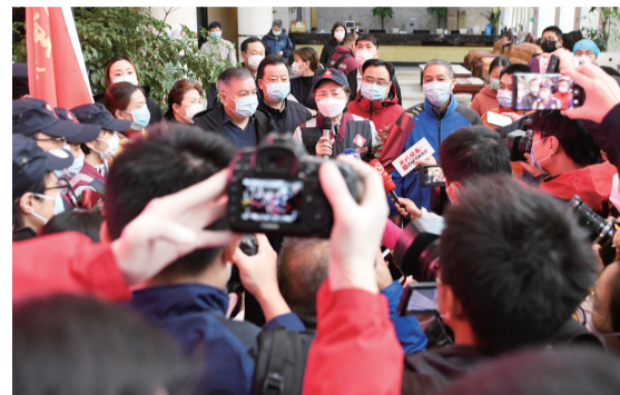
3月31日，李兰娟院士医疗队从武汉返程。国家卫健委组建的“援鄂重症新冠肺炎诊治李兰娟院士医疗队”由来自浙大一院和树兰（杭州）医院的医护人员组成，包括感染病学、重症医学、院感、护理等专业的人员。 □ 新华社发