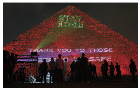
3月30日，在埃及吉萨的胡夫金字塔上打出标语，为抗击新冠肺炎疫情加油。截至3月29日，非洲新冠肺炎累计确诊病例已突破4000例。