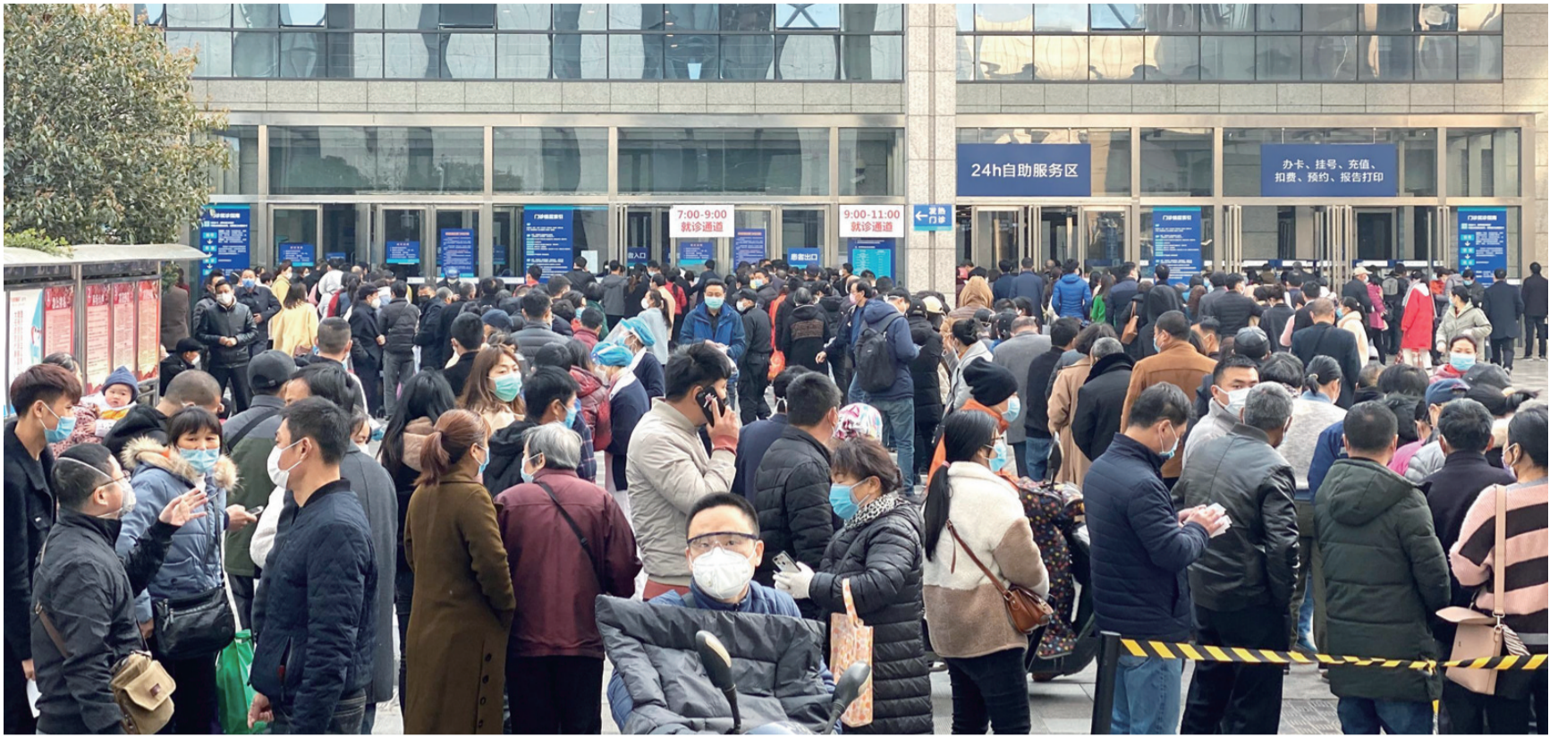
大量病患从全省各地赶往中国科大附一院(省立医院)