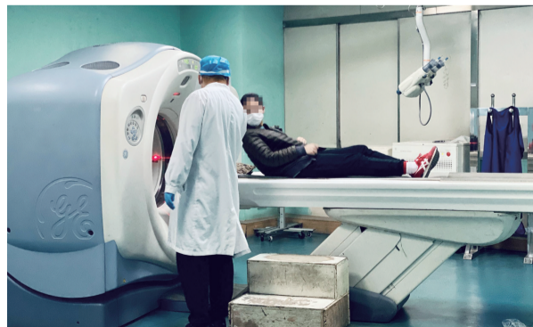
患者都需要经过新冠病毒肺炎CT影像排查