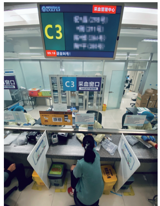
患者都需要经过血常规检验

在该医院住院部的门口,记者看到告示牌上写着“特殊时期,谢绝探视”。“我们要求所有住院患者只能有一名家属或其他陪护人员进入,且和患者一样须如实填写新冠病毒肺炎健康信息表,住院期间必须全程戴口罩,凭陪护证进出,且每天都要接受体温监测。所有病患都谢绝来院探视。”一名医护人员告诉记者,同样在等待患者手术过程中,也仅许一名家属等候。