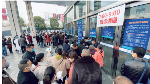
等待入院就医的患者排成长长的队伍