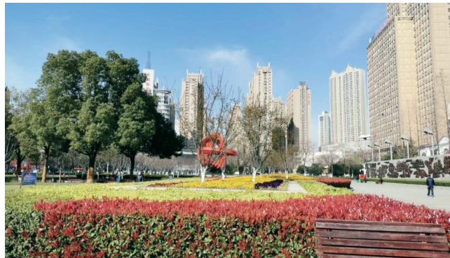
公园广场有序开放