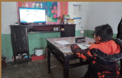
安庆怀宁某乡村特地为困难学子安装了数字电视