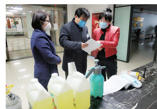
合肥经开区植树郢居委工作人员指导辖区企业复工