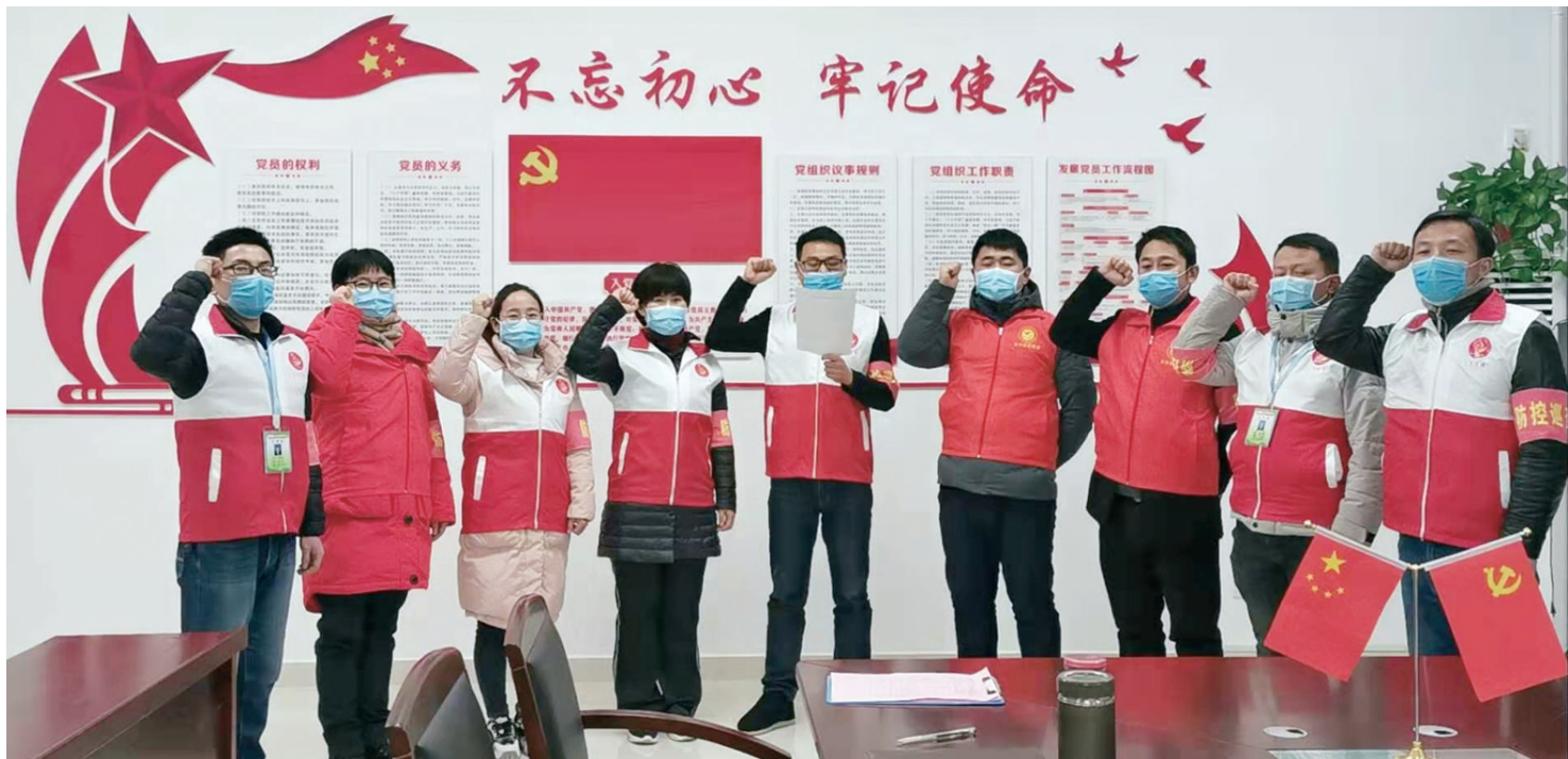
长丰(双凤)经开区峰宁社区党员集体宣誓对疫情开战

正面宣传提振锐气——疫情发生以来，开发区处快速组织新华社、市场星报等新闻媒体持续对安徽开发区抗击疫情工作进行广泛宣传，“关键在于着眼发展，提振锐气，开发区是经济发展的主阵地，宣传更要涤荡荡人心，打赢疫情攻坚战。”卢宏世说。