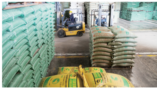
太和经开区有序组织企业复工复产