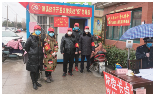
濉溪经开区党员战“疫”先锋队24小时坚守疫情前线