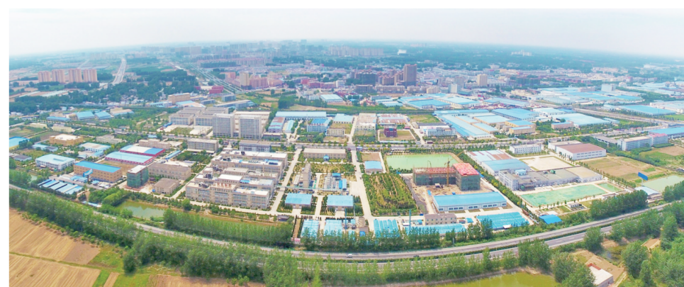
太和经开区鸟瞰图

太和经开区负责人说,中印合作以提升本土医药企业国际化水平,在学习借鉴印度药企管理体系、质量监控体系和国际化经营理念基础上,充分利用印度知名医药企业国际化营销渠道,帮助本土企业打开国际医药市场,加快国际化步伐。同时满足国内药品短缺、特殊病人等需求,大力引进品种、引进技术、引进投资、引进人才等,提升仿制药供给质量,解决用药贵和用药滞后的问题。