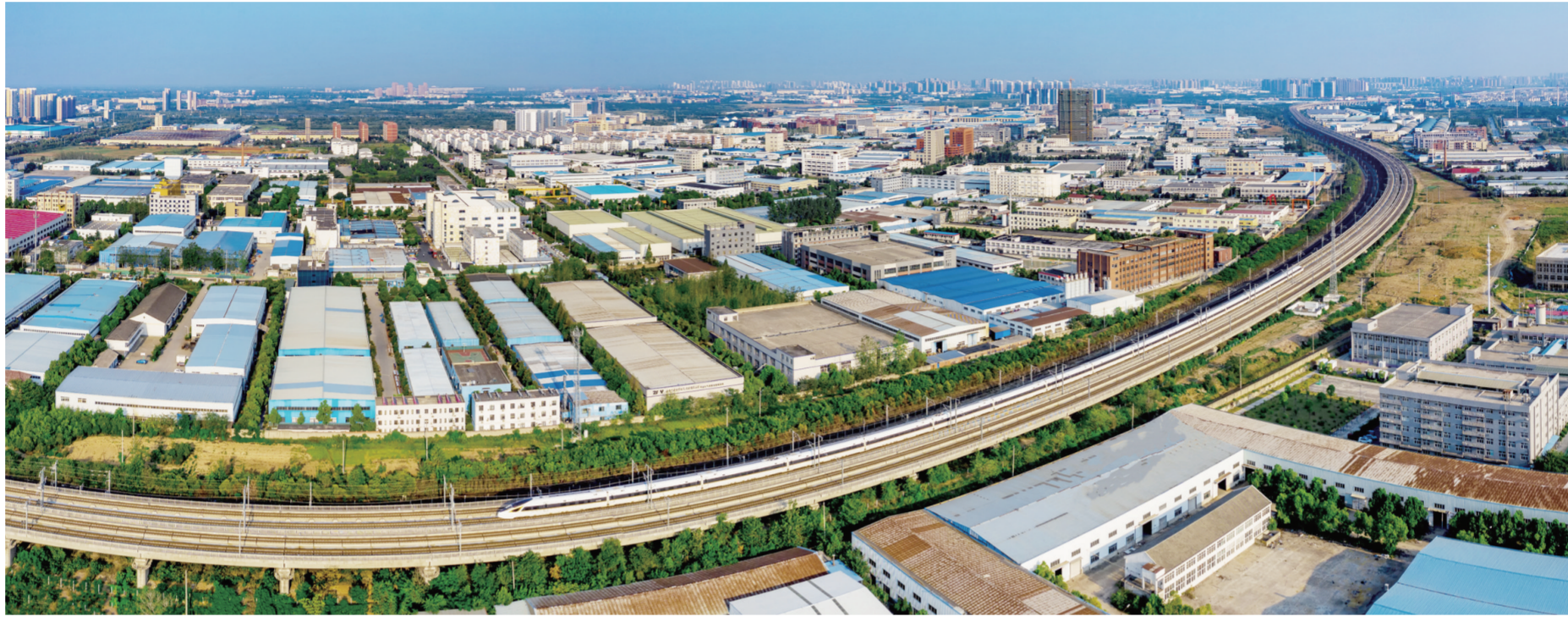
转型升级中的长丰(双凤)经开区

近年来,安徽省商务厅认真贯彻落实省委省政府关于对外开放的工作部署,把扩大对外开放落到实处,结合党中央、国务院相关文件和省政府关于建设国际合作产业园、打造改革开放新高地的要求,推动国际合作产业园落地。目前,全省已有多个开发区在积极筹建国际合作产业园,在建设美好安徽征途上砥砺前行。 □记者 赵汗青