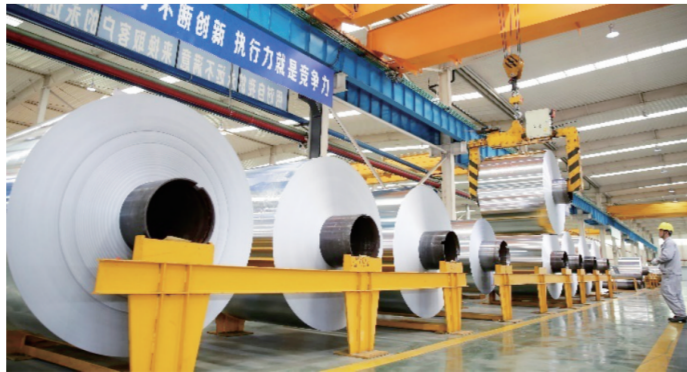
濉溪经开区安徽华中天力铝业有限公司