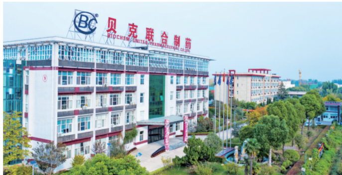
太和经开区贝克联合制药