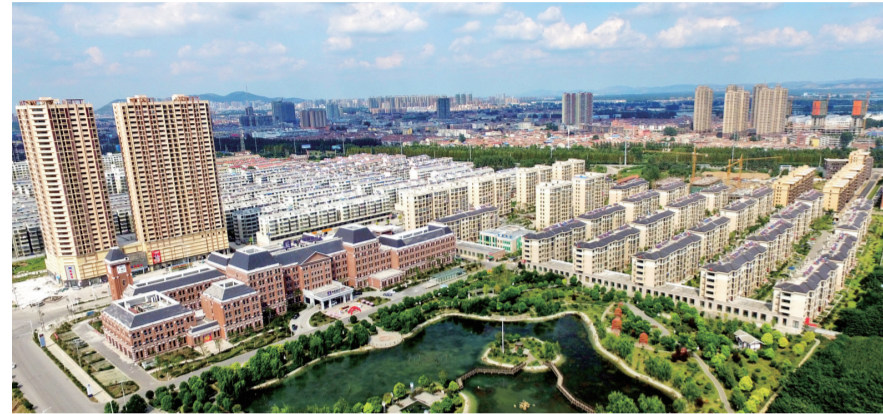
濉溪经济开发区一角