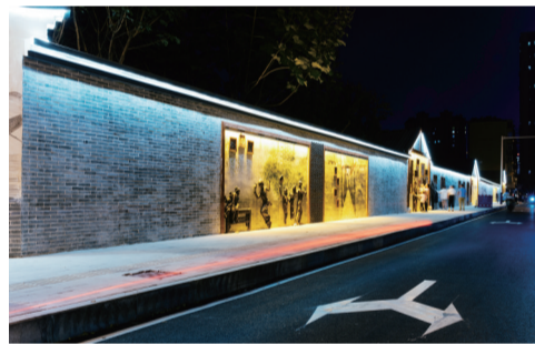
9月份以来,合肥瑶海区启动了滨河路、沿河路城区交接区域的环境综合提升工作。近日,记者从该区域城管局获悉,项目改造已完工,全面向市民开放。 □杨晓雨 星级记者 汪婷婷 文/图