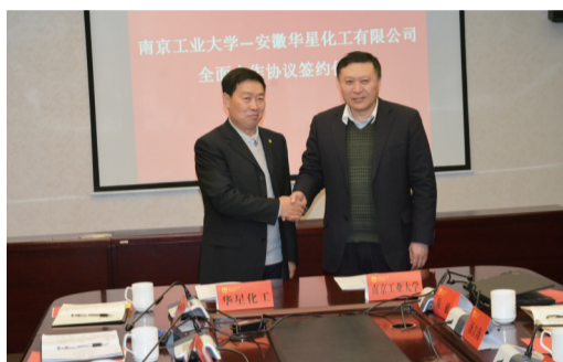
华星化工与南京工业大学签署全面合作协议