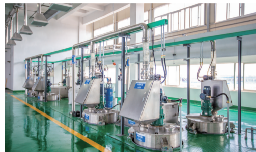
绿色智能化制剂加工中心