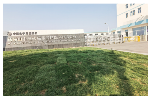
马鞍山中电熊猫重装防腐科技有限公司