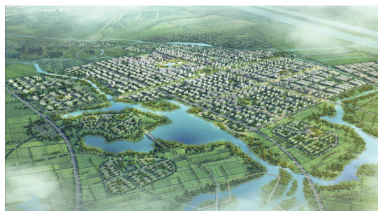
江北乌江新区规划效果图