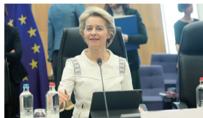
新任欧盟委员会主席冯德莱恩

12月4日,在比利时首都布鲁塞尔的欧盟总部,新任欧盟委员会主席冯德莱恩出席她领衔的欧委会第一次会议。当天,新一届欧盟委员会第一次会议在比利时布鲁塞尔的欧盟总部举行。11月27日,欧洲议会在法国斯特拉斯堡投票通过了以乌尔苏拉·冯德莱恩为主席的新一届欧盟委员会委员名单。12月1日,冯德莱恩正式就职。 □ 据新华社