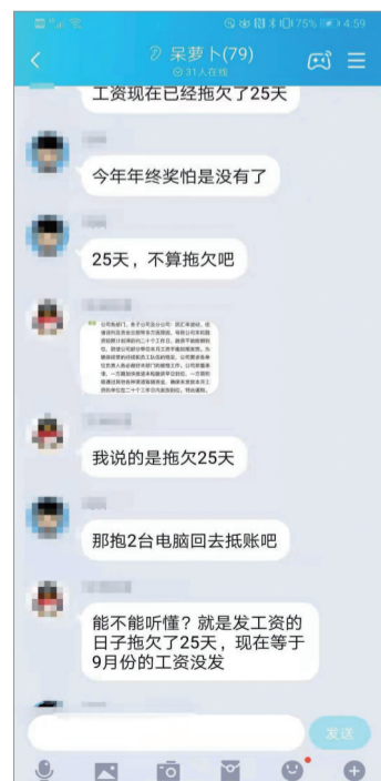
呆萝卜群里有人称自己9月份的工资还没发