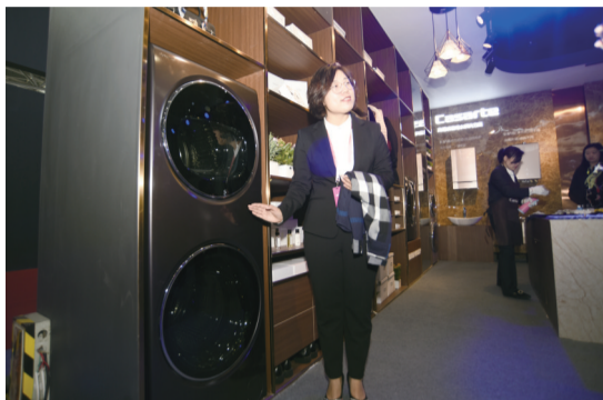
价值10万元的融合纤维洗衣机