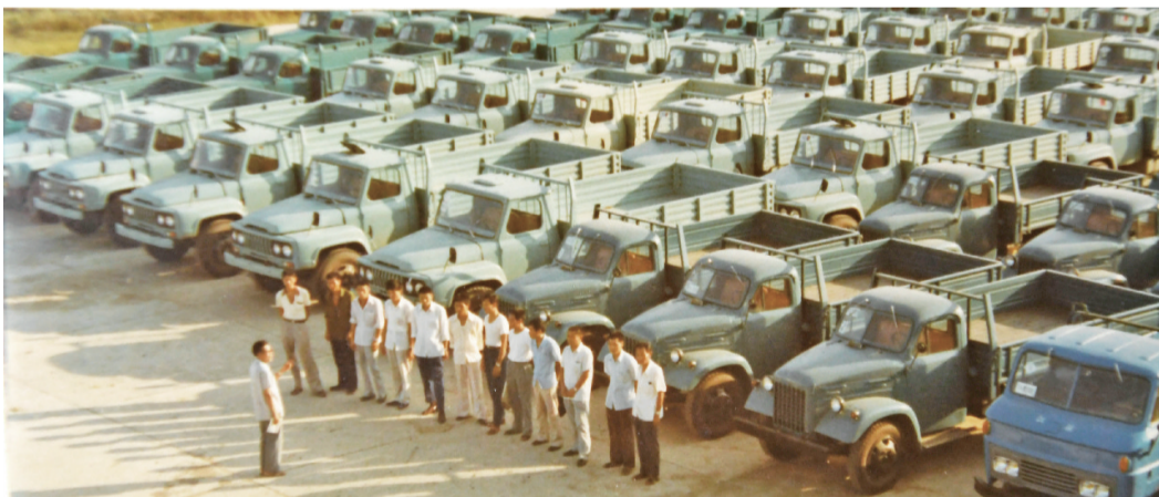
1983年，国家汽车工业部门，为支援皖东农村，将数百辆汽车开到滁州，供农民选购