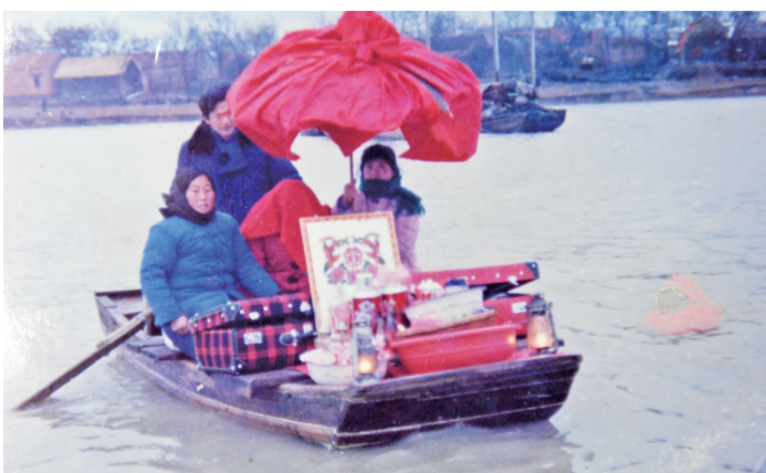
1982年，嘉山县女山湖，水上婚礼