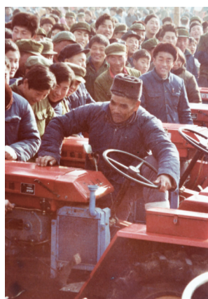
农村集市中的农机市场