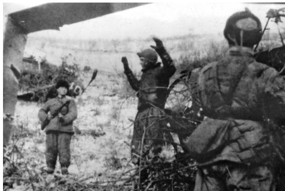
1951年秋，金城前线，俘获飞贼，拍摄于抗美援朝战争中

我们学员用的都是从战场上缴获的简易的柯达相机和胶卷，晚上钻在被窝里学习冲洗胶卷。一个