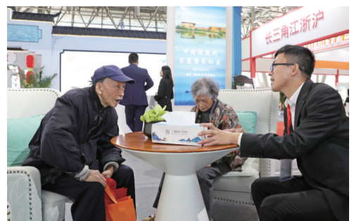
老人正在咨询养老服务