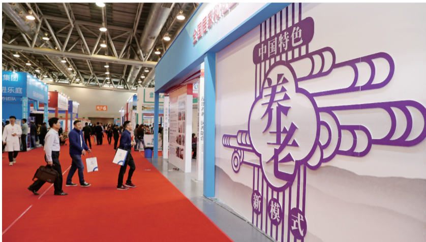
老博会吸引了大量市民前来观展