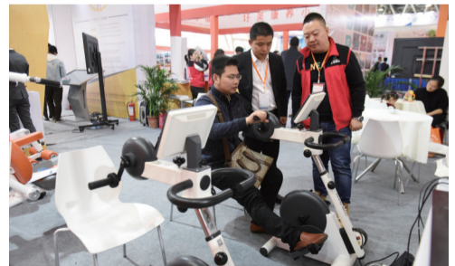
智能主被动健身器材