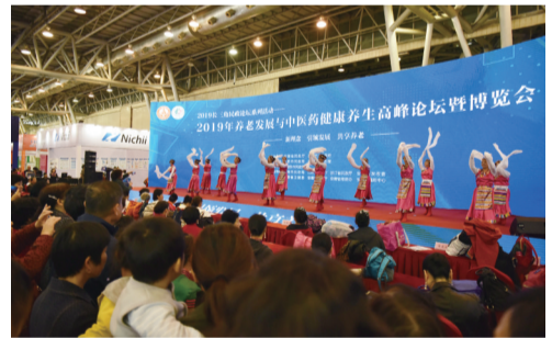
热闹的文艺展演吸引了不少市民的目光