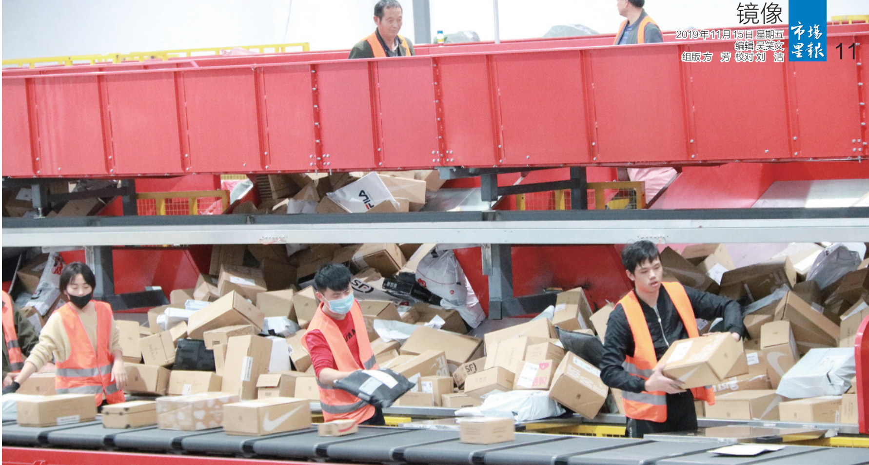
为了应对“双十一”的到来，顺丰实行轮班制