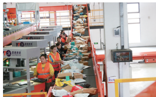
为应对“双十一”，圆通聘请了400多名工人帮助分拣