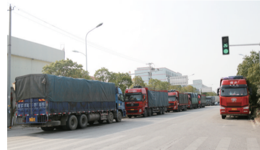
装载快递包裹的货车停在道路两侧绵延数条马路

据了解，“双十一”快递高峰期期间，合肥多个社区还组织开展快递安全检查宣传工作。与此同时，为保障消费者申诉渠道畅通，安徽省邮政业消费者申诉受理中心不仅增加了工作人员和接听专线，“12305”申诉热线双休日也正常运行。