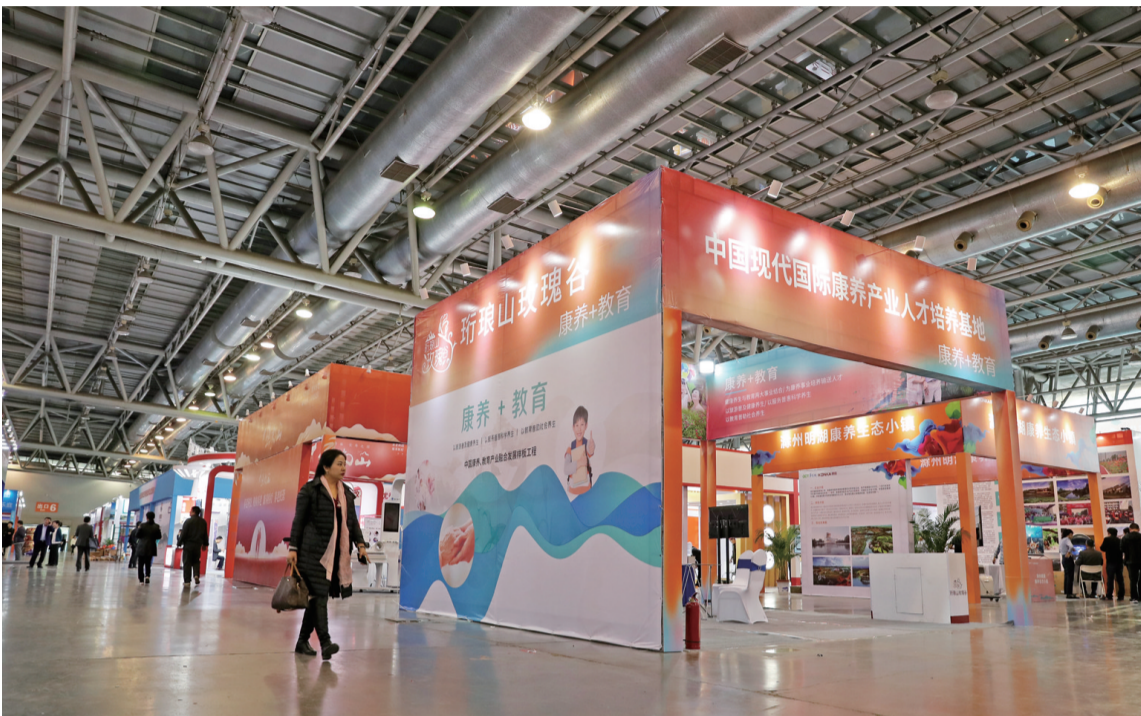
各大展区紧张备展