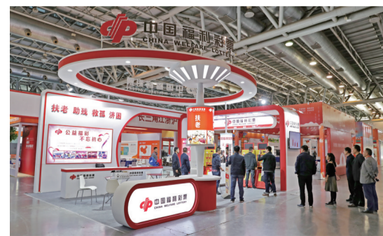
安徽福彩中心展区