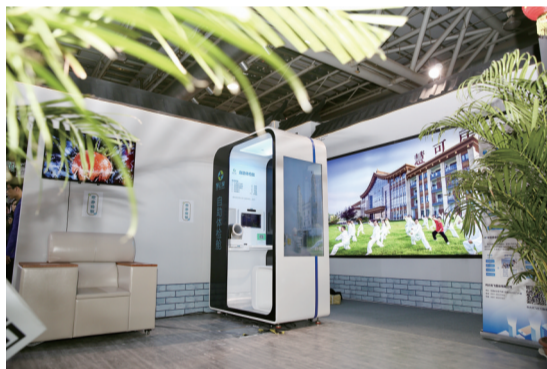
安徽静安健康产业集团的自助体检舱