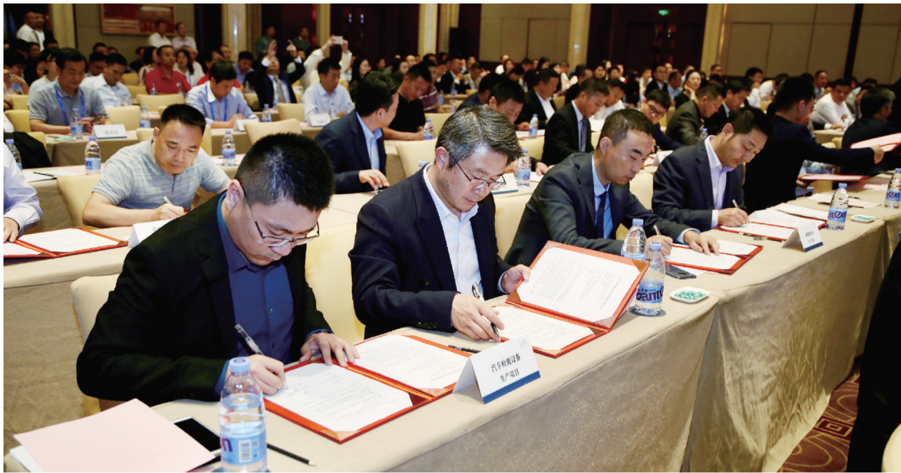
安徽省投资环境推介会暨项目签约仪式现场

本届高交会上,安徽邵氏华艾公司带来的“纳米刀肿瘤消融系统”、哈工大机器人集团的“六轴人机协作机器人”、中国电子科技集团公司第三十八研究所研制的“被动式太赫兹人体安检系统”等项目,亮相高交会第一天就广受客商的高度关注,并当场进行了对接洽谈。 □ 记者 徐越蕃/文