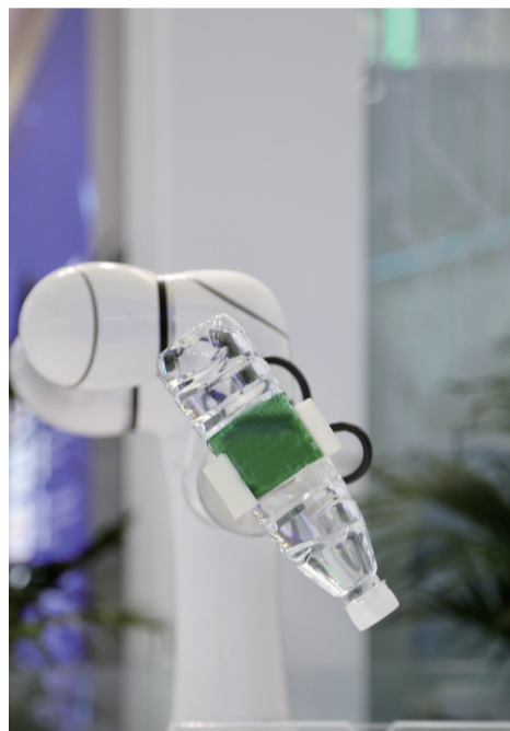
哈工大六轴自主协作机器人

“一秒过安检,就能被探知身上是否携带了金属、液体等违禁品。”据介绍,被动式太赫兹人体安检系统是采用国内首创的被动式太赫兹实时成像技术,实现对人体随身携带的包括武器、爆炸物、违禁品在内的金属和非金属的探测,探测距离长达8m。是经两届进博会实战检验的高端安检设备。