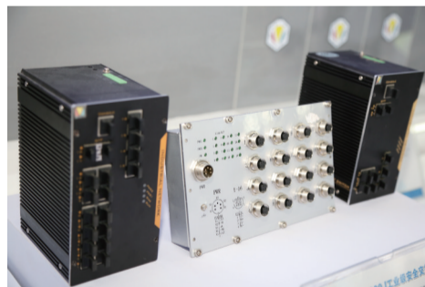
安徽维德工业级安全交换机