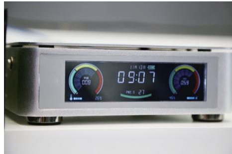
合肥杜威智能科技股份有限公司甲醛测试仪