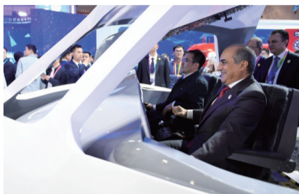
外国友人在中国馆试驾模拟机舱

虚拟现实、人工智能、刷脸支付……现场,中外来宾不仅“驾驶”着C919“飞”上蓝天,还操作着“深海勇士”号深海“作业”,今年的中国馆,由于互动性大大增强,吸引了一波又一波的来客。记者了解到,由于今年进博会将不再设置社会公众日,为满足广大市民的观展愿望,国家馆将在进博会后进行延展,于11月13日至20日向社会观众免费开放。