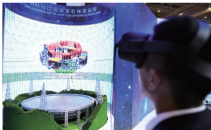
中国馆的“天眼”,很多观众争相观看