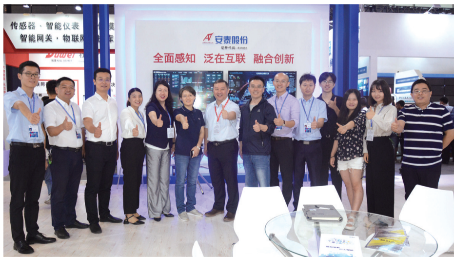
安泰股份工作人员在制造业大会上