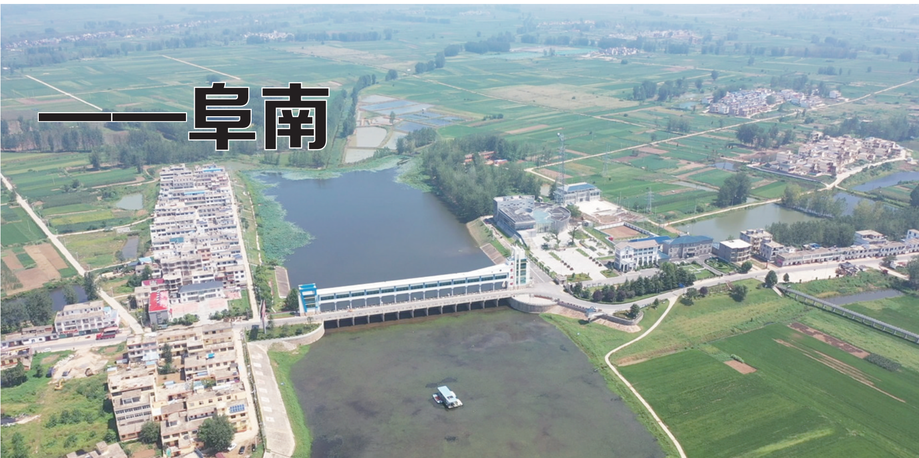
千里淮河第一闸——王家坝闸