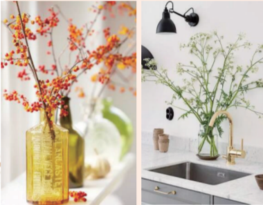
阳光暖暖的照进来，透着花瓶的光，折射着花的色彩，想想就是美极了。