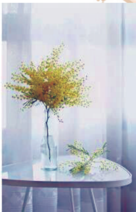
这个位置放上一瓶插花，整个家的颜值直线飙升了，学习或工作效率都能提高不少吧。