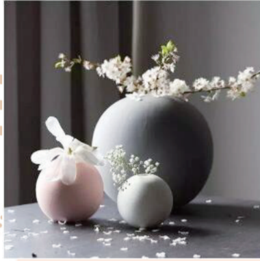
这样的圆形花瓶，不管配上什么花，放在家里也都是美呆了。

现代研究认为，菊花含有多种营养物质，具有抗菌、抗病毒、解热、抗衰老等作用。用菊花泡茶，不宜长期连续饮用，一般3-5天即可。而体质偏寒的人不妨放点枸杞，而脾胃虚寒的人最好少喝。