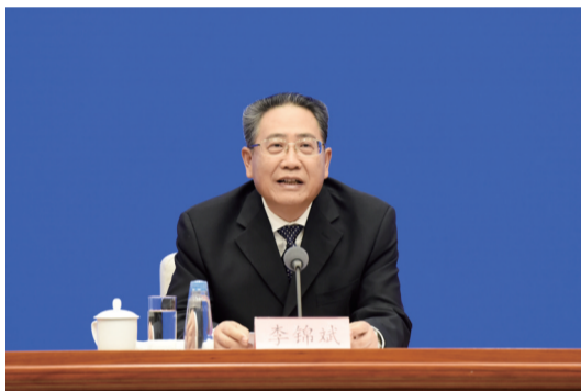
省委书记、省人大常委会主任李锦斌