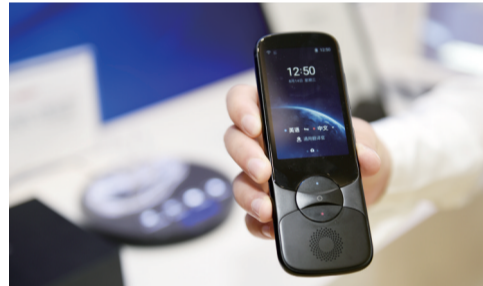
科大讯飞最新翻译机产品

安徽森林面积约占长三角的1/3，皖南山区和皖西大别山区是华东重要生态屏障。安徽在全国率先