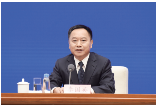
省委副书记、省长李国英