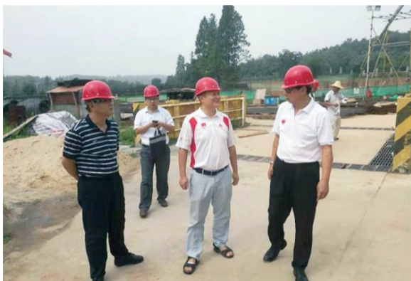
高维岭在省水上中心开展主题教育调研

7月4日~5日，省体育局党组书记、局长高维岭分别到省水上运动管理中心、省射击运动管理中心和省体育中心开展“不忘初心、牢记使命”主题教育专题调研。