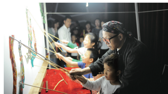
5月18日，安徽省地质博物院举办了“关爱江豚，保护生态”主题活动。其中，由省级非物质文化遗产安徽马派皮影传承人马飞团队创作并演绎的“江豚皮影戏”，以濒临失传的传统皮影技艺展示了“小江豚历险记”。 □ 黄慧 星级记者 汪婷婷 文/图

根据教育部要求，报名时间安排在今年高考前进行，10月份面向2019年退役士兵再增加一次补报名。考生免于文化素质考试，由学校组织相关职业适应性测试或技能测试，具体要求由各招生院校自主确定。