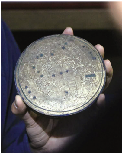
曾经获巴拿马万国博览会金奖的地球墨