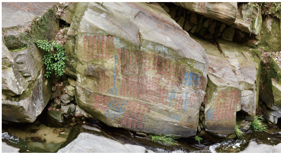
三祖禅寺摩崖石刻

当游客走到痘姆古陶的古窑边，低矮的砖房、沧桑褪色的瓦顶、粗糙的制陶拉坯现场，场面无一不让人震撼，走入期间，现实与传统在激烈地碰撞着。在展馆内，这里有建盏、水壶、茶具，也有挂件、饰品，百余平米的房间内陶器制品琳琅满目，有紫红色、酱红色，有点缀花纹、不规则的图案，在这成百上千的陶器制品里，千姿百态却找不出完全相同两件，令人啧啧称奇。如今，在一代代的传承中，痘姆乡的工匠们也在不断创新，为古陶增添新的生命力。