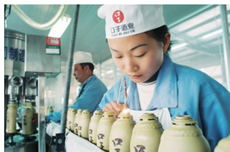
口子酒业职工正在加紧生产

“此次省商务厅组织‘媒体进园区’活动，是濉溪经济开发区的难得宣传推介机会，有力地促进了开发区招商引资工作的开展。”他希望，省商务厅和新闻媒体能够一如既往地关心濉溪的发展，一如既往地支持濉溪经济开发区，传递濉溪好声音。