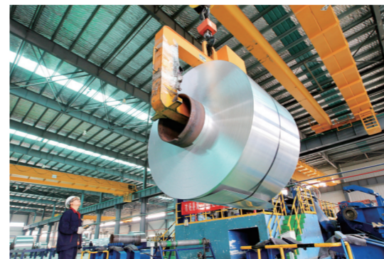
安徽美信铝业冷轧车间