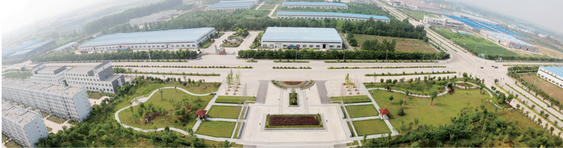
濉溪经济开发区鸟瞰图