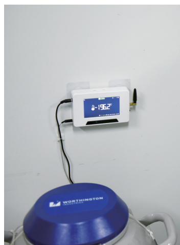
液氮罐冷冻温度达到-196.2℃