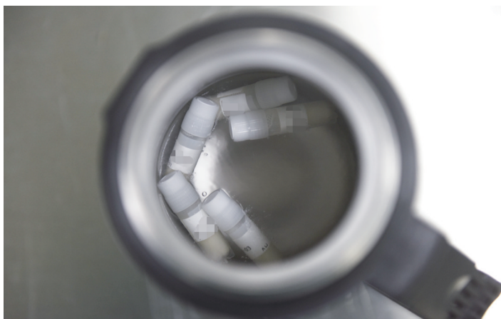
复苏中的精子样本

据了解,安医大一附院精子库最多可储存4万份精液标本,不仅可以满足本省患者需求,还可以为周边省份患者提供帮助。目前,安医大一附院为第27家通过国家批准的人类精子库,安医大一附院精子库的成立填补了安徽省人类精子库技术服务的空白。