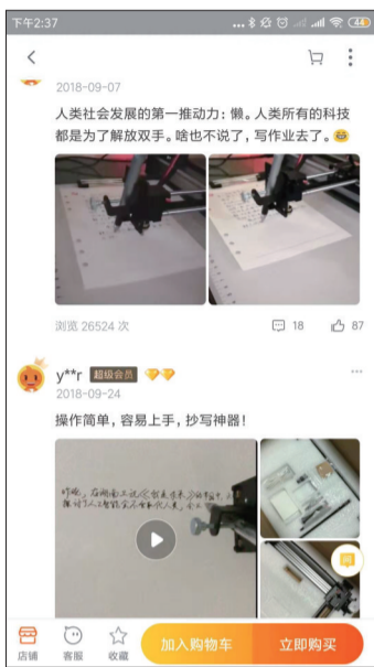
写字机器人购物页面下的买家评论