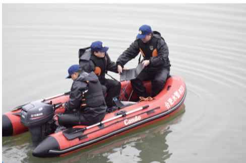
水警使用声呐设备