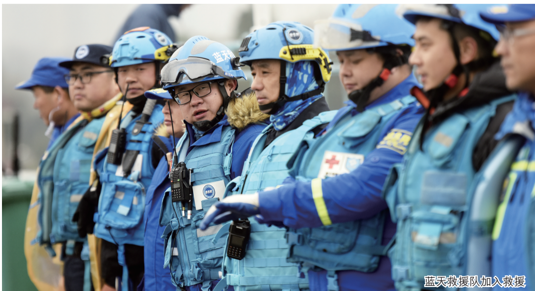
蓝天救援队加入救援