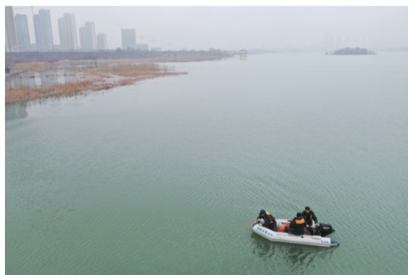
合肥水警在董铺水库展开搜寻