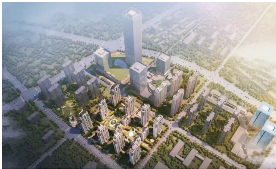
合肥绿地中心鸟瞰图

未来绿地在安徽的发展战略将继续以合肥为主，加大在合肥投入，担负起城市运营商的职责，以“世界的绿地”的身姿，以全球化的视野，安徽带来更多的精品项目。“可以说，绿地集团是全国品牌开发商中对安徽投资开发力度最大、推进城市建设和发展速度最强的企业。”初心不改，绿地会继续扎根合肥，再创未来。