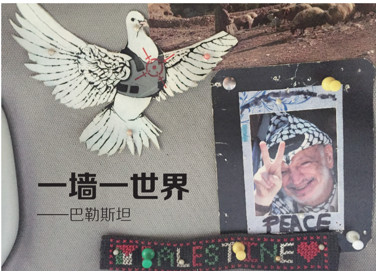
巴勒斯坦出租车上随处可见——叼着橄榄枝的和平鸽和举着胜利手势的阿拉法特像

巴勒斯坦,历史上曾是多民族的居住地。公元前1020年到公元前923年,犹太人建立希伯来王国,后亚述、巴比伦、波斯等外族都曾占领巴勒斯坦。公元前1世纪罗马帝国侵入,绝大部分犹太人流往世界各地。之后随着阿拉伯人不断移入并和当地土著居民同化,逐步形成了现代巴勒斯坦阿拉伯人。