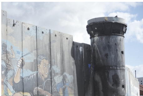
隔离墙的以色列军队哨岗被巴勒斯坦青年丢掷燃烧瓶