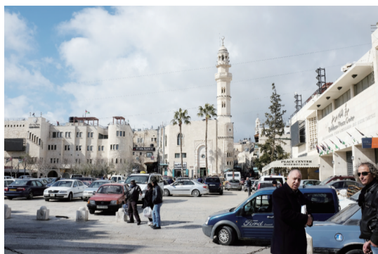
马槽广场位于伯利恒的中心, 圣经中耶稣的诞生地