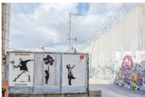
隔离墙下,全世界的和平主义者留下了壁画,还有国际组织印刷的当地故事