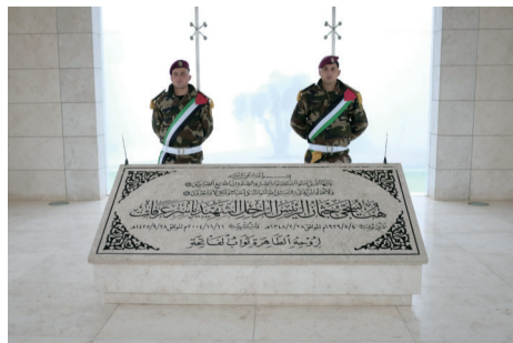
位于拉姆安拉的巴勒斯坦前领导人阿拉法特的墓室