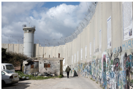
一名巴勒斯坦人在隔离墙下走过