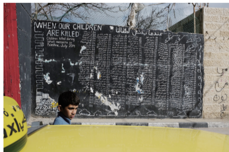
巴勒斯坦城市伯利恒街头的墙上记录着死于以军枪下孩子的名字