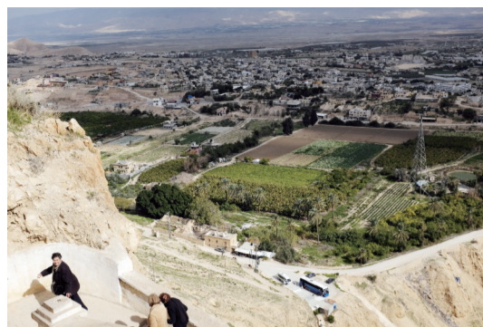
世界上最古老也是最低的城市——杰里科