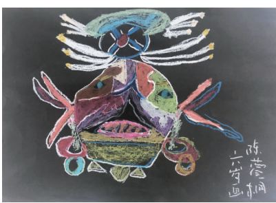
▲姓名:陈萱桐 年龄:6岁 指导老师:查玮玮