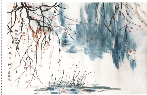
▲姓名:卜若拙 年龄:12岁 指导老师:查黎明 学校:星星美术