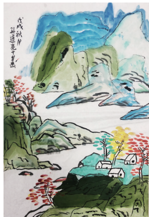
▲姓名:孙道亮 年龄:10岁 指导老师:查黎明 学校:星星美术