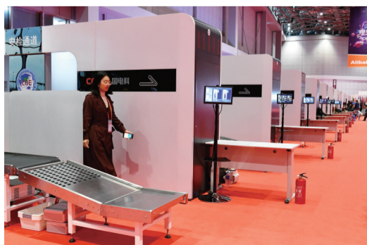
本报记者体验中国电科38所研发制造的太赫兹人体安检设备