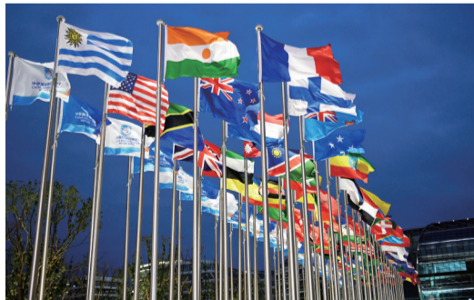
来自世界各国的国旗迎风飘扬