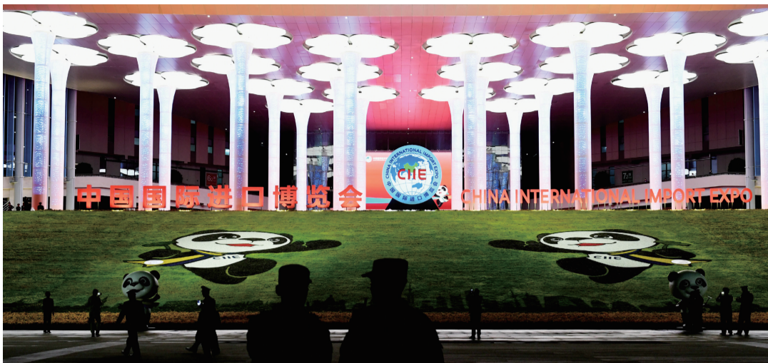
中国国际进口博览会主展馆