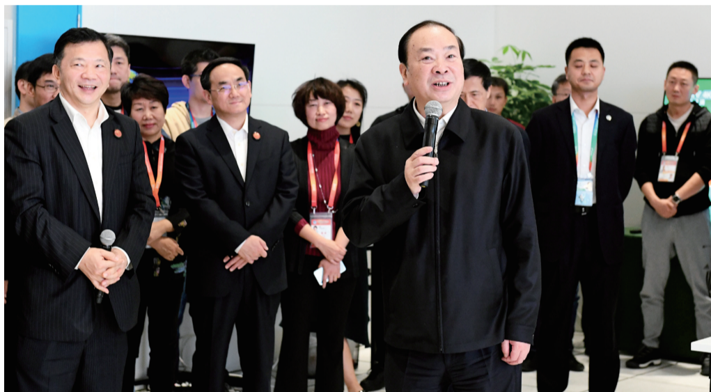
11月4日下午,中央政治局委员、中宣部部长黄坤明在中国国际进口博览会新闻中心看望新闻媒体记者

本次大会期间,我省除重点参加组委会统一安排开幕式、虹桥国际贸易论坛等重大活动外,还将充分利用进博会国家级高水平开放平台的溢出效应和平台作用,策划举办以“开放合作 共享发展”为主题的安徽省进口需求发布会暨合作交流恳谈会。活动将于11月6日在上海国际会议中心举行,规模约500人。届时,将围绕安徽省进口需求发布,合作项目集中签约,合肥综合性国家科学中心、智能制造和旅游合作交流恳谈,境外知名企业安徽行启动仪式等内容,重点邀请境外参展客商及友好省州代表等来宾参会。