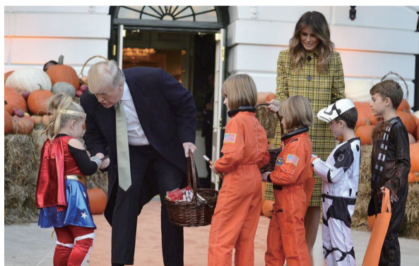
10月28日，美国总统特朗普夫妇在白宫发糖果给孩子们，庆祝万圣节。

尽管存有争议，但特朗普的计划也赢得一些保守派人士的支持，他们强调，第14修正案的适用对象是美国合法永久居民，而不是未经授权的移民或持临时签证的人。查普曼大