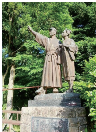
伊豆的森林深处树立的《伊豆的舞女》铜像