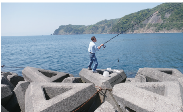
当地人的惬意生活