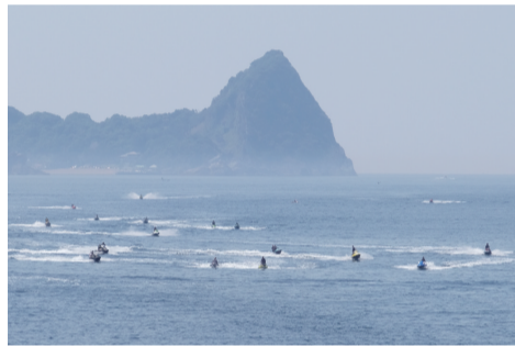
伊豆半岛海边的水上运动