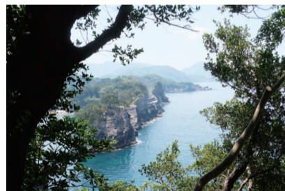
奇石连绵不断的堂岛