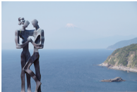
恋人岬远眺海对面的富士山

在距离西伊豆出入门户的土肥港口不远的恋人海峡，人们在这里，可眺望“海面上的富士山”的壮丽景色。