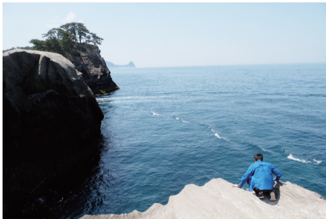
堂岛美丽的沿海地貌