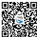
掌上安徽 微信二维码