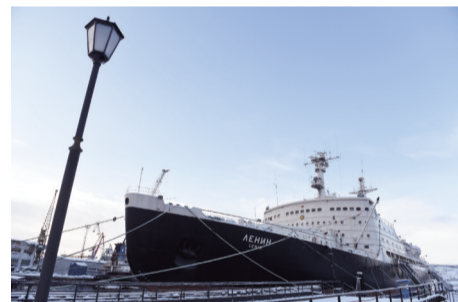
世界上第一艘核动力破冰船列宁号,退役后停泊在摩尔曼斯克码头作为博物馆