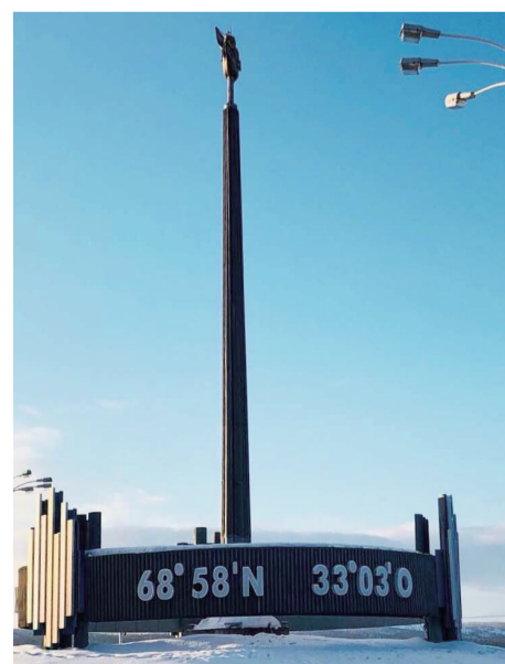
摩尔曼斯克城外竖立着标志塔