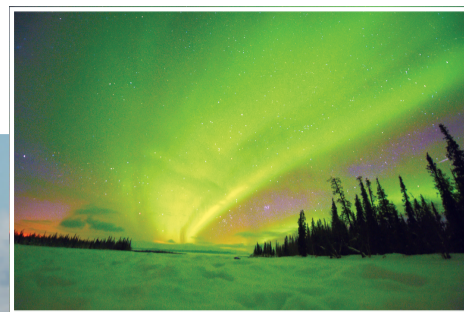
作为北极圈内的城市,郊外看见极光是一件非常容易的事