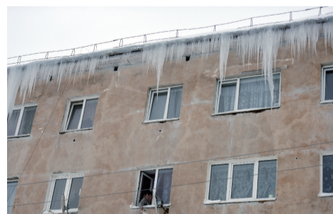
冬季零下40度的极寒温度