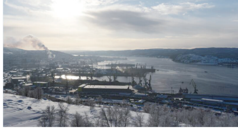
科拉湾位于俄罗斯摩尔曼斯克州内科拉半岛北部,即俄罗斯科拉半岛北岸