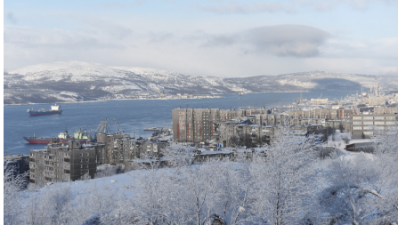
城区主要街道的建筑大都是上世纪50年代兴建的5层高的建筑