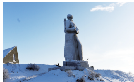
矗立在山顶的阿廖沙士兵雕像