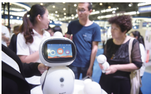
(合肥)荣电集团的智能小家电机机器人