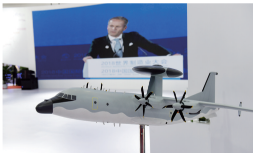
合肥造预警机雷达