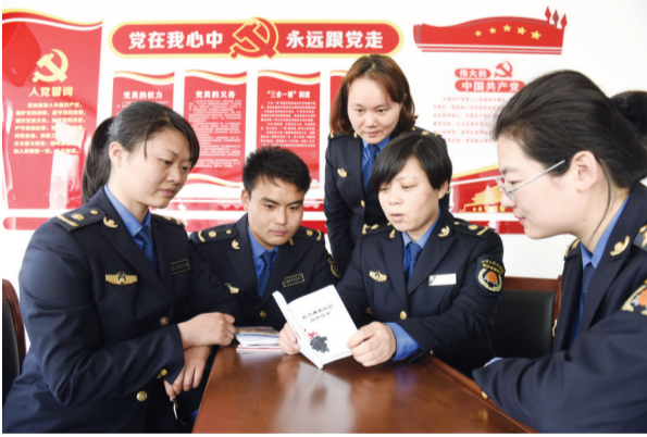
基层工作人员学习党风廉政建设知识