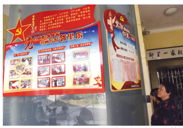
党风廉政建设深入基层