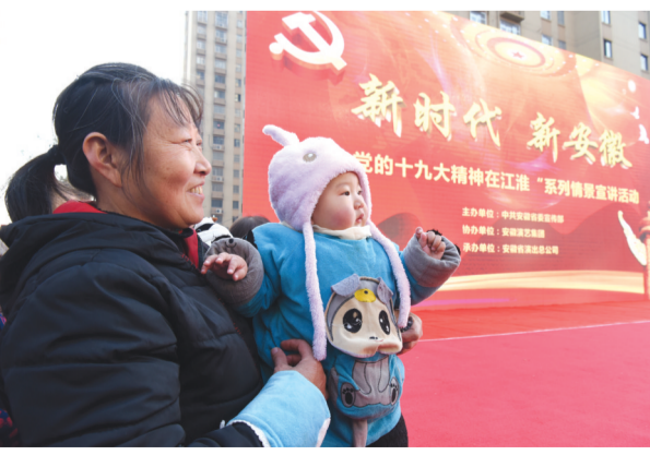
坚持党的领导 生活越来越美好