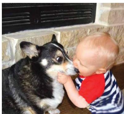
汪星人的鼻子好吃吗?