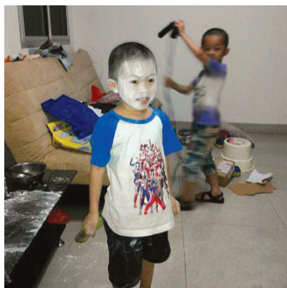
麻麻,你是这样做面膜吗?