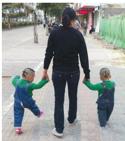
两个孩子,这样分大小,一目了然。

横向:1.指在危急处境下,掩饰空虚,骗过对方的策略。民间最有名的故事取自《三国演义》。