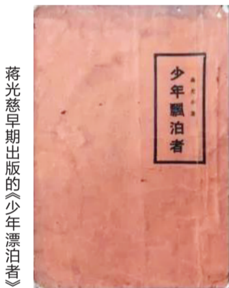
蒋光慈早期出版的《少年漂泊者》