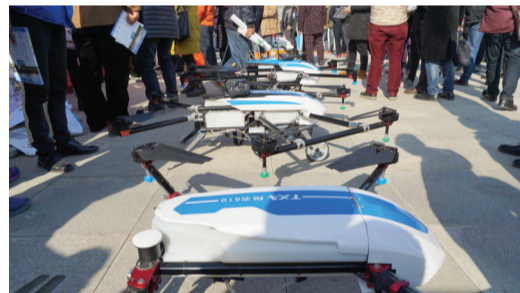
植保无人机为农业插上“科技”翅膀