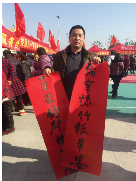
领到了免费春联好开心

记者了解到,今年,安徽出版集团向小溪河镇的14个农家书屋共捐赠了价值20万元的图书。此外,“三下乡”期间,凤阳县图书馆还将举办“过年展览”,包括有声电子贺卡、趣味闯关答题、在线摄影征集、戏曲知识库展览等丰富的线上读者活动。