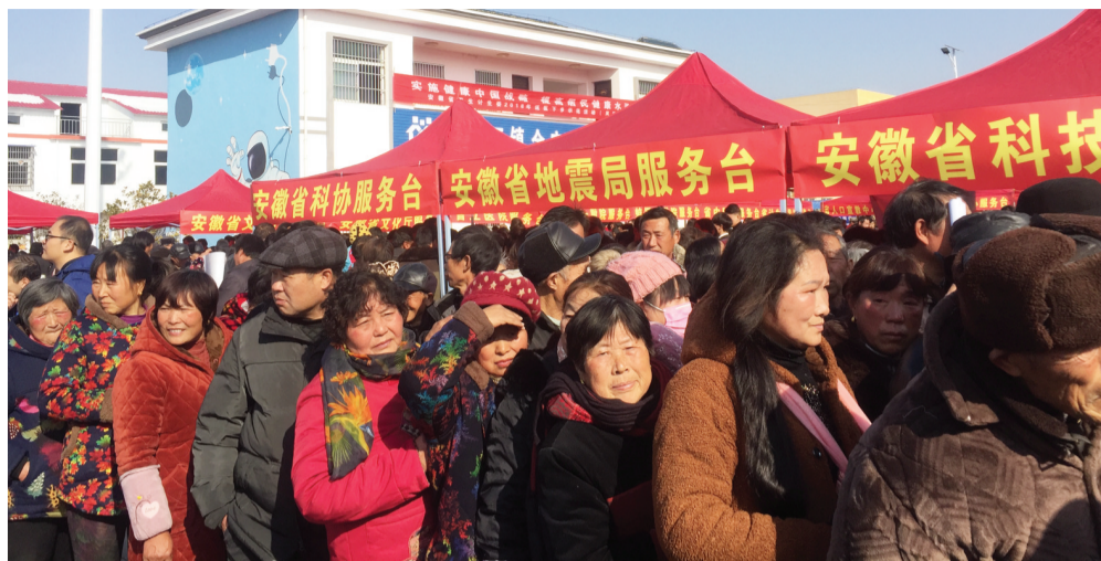
活动现场,各大展台前人头攒动

1月15日,由国家发改委和安徽省委、省政府联合举办的2018年全国暨安徽省文化科技卫生“三下乡”集中示范活动,在农村改革发祥地安徽省凤阳县举行。昨日的风阳县小溪河镇金庄村农民文化广场,人头攒动,热闹非凡。广场中央有精彩的文艺演出,广场四周的文化、科技、卫生、农业等相关展台前更是挤满了前来咨询、领免费物资的农民朋友,人们在温暖的阳光下享受着一场精神文化盛宴。 ■ 记者 汪婷婷 文/图