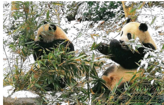
1月8日凌晨,第一场瑞雪降临成都大熊猫繁育研究基地都江堰繁育野放研究中心——中华熊猫谷。可爱的大熊猫们在雪地里尽情打滚撒欢。