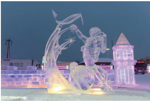
1月8日,第三十二届中国·哈尔滨国际冰雕比赛圆满落幕,共计14个国家、34支代表队的68名艺术家参赛。 ■ 据中新社